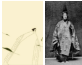
costume du théâtre Nô