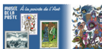
Le musée de la poste

Un descriptif historique suit le film, le lire avant de demander aux élèves ce qu'ils ont pensé du film.