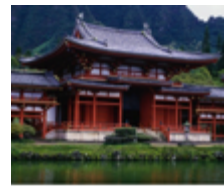
Temple de Byodo-In

Pour les plus jeunes, leur demander ce qu'ils ont ressenti.