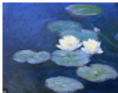
« Les nymphéas » de Claude Monet